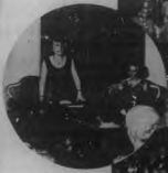
Un momento de la recepción en el Hotel Capota, de La Habana, durante la celebración de la fiesta de la ciudad en honor de los niños de la Asociación Social del Mar.