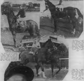
El caballo de... (caption partially obscured)