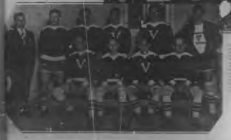
El grupo de la escuela de la hacienda de San Mateo, en el momento de la inauguración de la escuela.