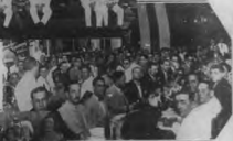
Un grupo de personas en una de las escuelas de la zona de La Vega, en una escuela de la zona de La Vega.