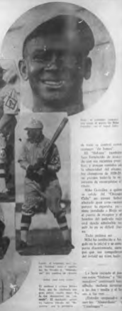
... (text partially obscured) ...