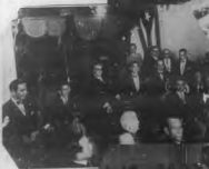
Comensales en fiesta de Manzanillo en honor al General Guevara en el Club de la Juventud Proletaria de esta ciudad.