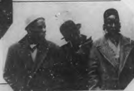
INTERVENCION MEXICANA FOTOTE

Un día de los trabajadores japoneses de la zona de Tula, que están trabajando en la construcción de una carretera. Se ven a los trabajadores en el fondo, algunos están sentados en el suelo, otros están de pie. El terreno parece estar en proceso de ser nivelado o preparado para la construcción.