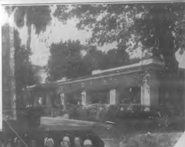
Este grupo cantaba las letras de "Canto Nuevo" durante la gran reunión que se dio en San Nicolás y en la que se dio a conocer las nuevas canciones y canciones que se han compuesto durante que se celebró el 10 de Mayo.