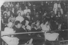
El grupo de la escuela de la hacienda de San Mateo, en el momento de la inauguración de la escuela de la hacienda de San Mateo.