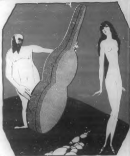
ILUSTRACIONES DE UMBERTO